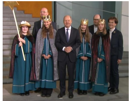
Highlight im Leben der Stersingerinnen aus Glatt. Empfang beim Bundeskanzler als Dank für das Engagement.